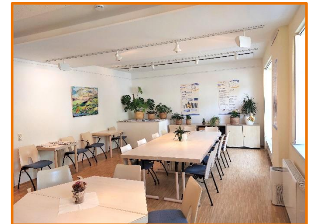
Gruppenraum im EG