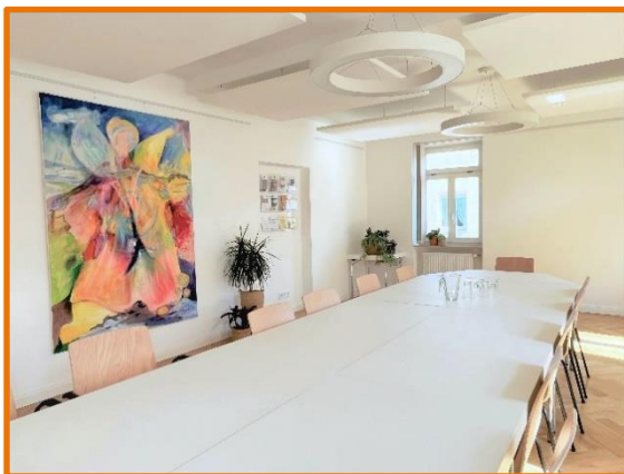
Gruppenraum im 1. OG

Ausgeschlossen sind politische, Werbe- und Verkaufsveranstaltungen sowie private Feiern.